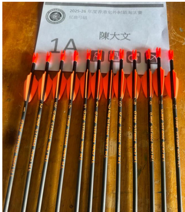
此圖只供拍攝位置擺放參考

請所有參賽者將需申報的個人資料工整地標示(手寫或張貼)於各箭支之相同方向（如上圖所示），以便紀錄與辨識。