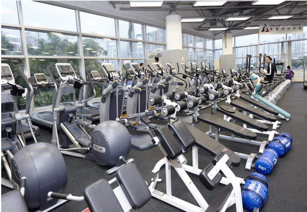
(香港體育學院體能訓練中心)