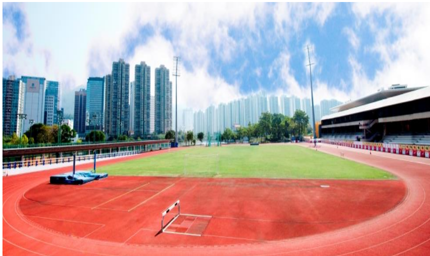
(香港體育學院田徑場)

本課程以六個月兼讀制形式修讀，課堂於晚間在沙田香港體育學院上課。有意申請者，可瀏覽體院教練培訓部網站 www.hkcoaching.com 查詢上課時間表。