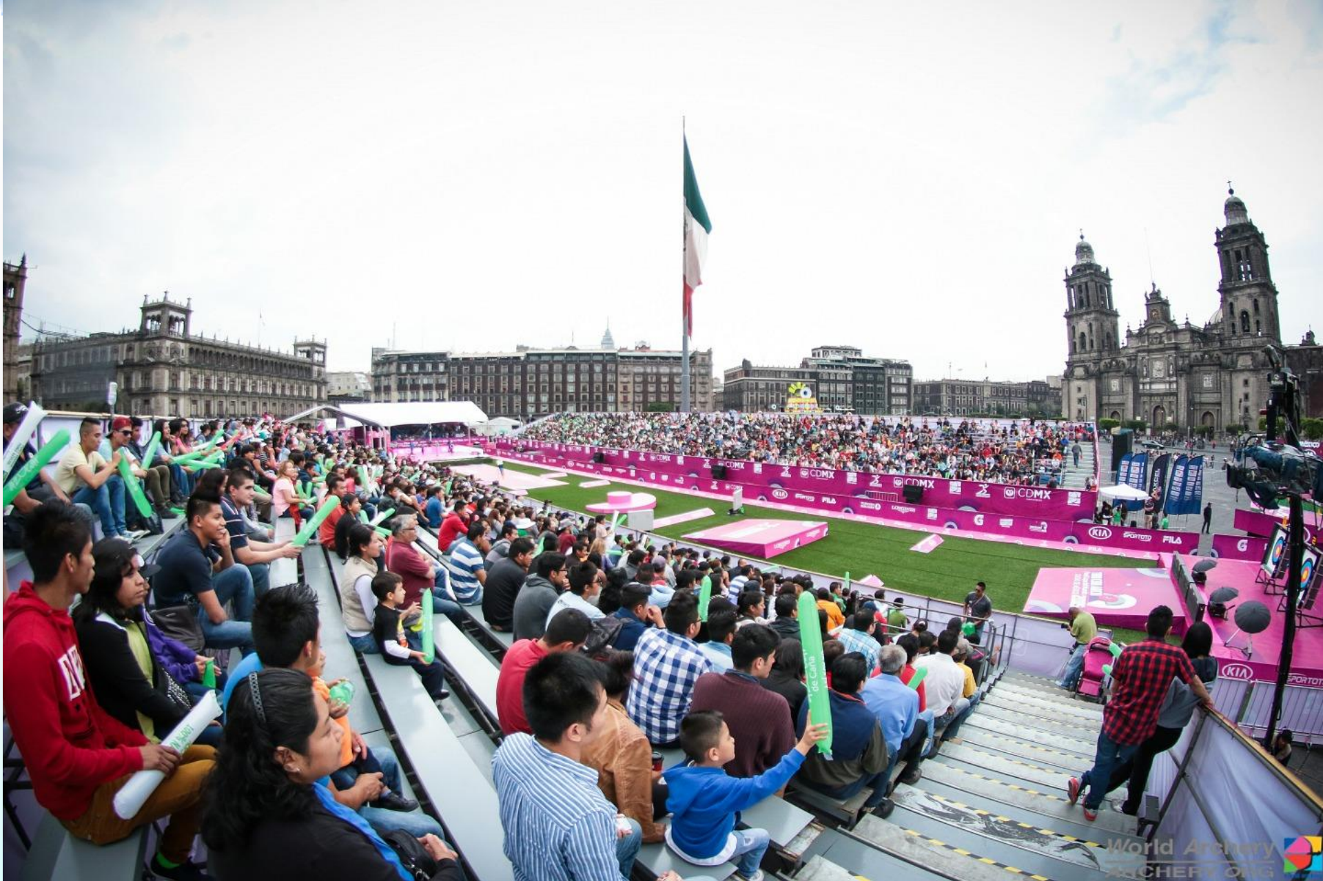
Mexico City 2015 Archery World Cup